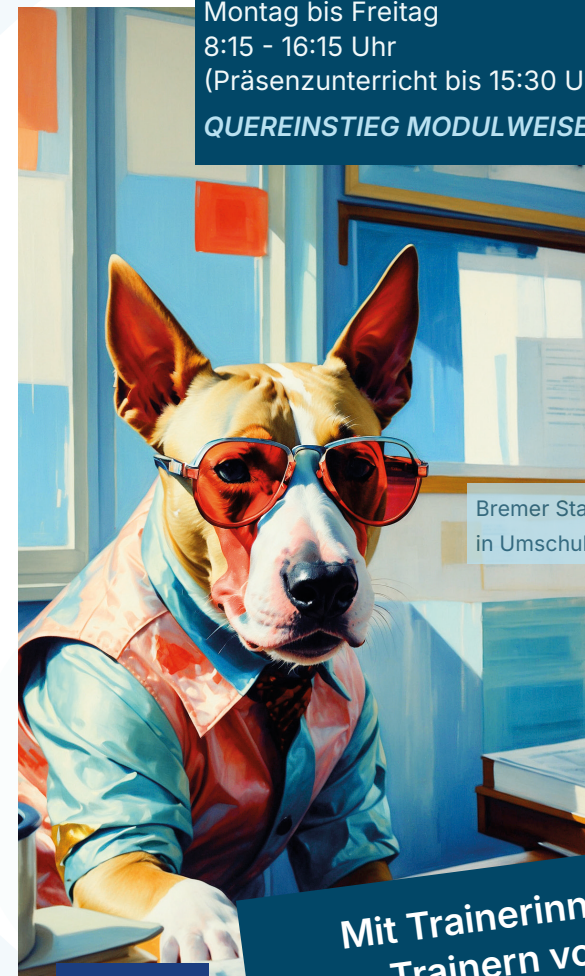
Bremer Stadtmusikant in Umschulung